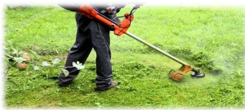
PODA CASA ARQUIDIOCESANA

Poda mensual o como lo requiera la parte técnica de nuestro Jardín las gramas, arbustos, palmeras, acondicionamiento de las áreas, realización de cerquillos para delimitar los jardines y mantener la belleza natural de las áreas con un cuidado extremo de nuestras matas.