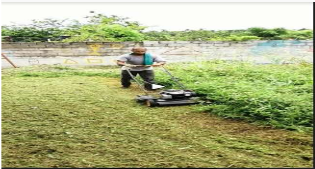
FIG 1.A PODA VISION MUNDIAL

• • LEY AMBIENTAL 64-00, con el que adquirirás los conocimientos referentes a un Sistema de Gestión Ambiental y a su posible certificación, es para ello que nos apegamos a leyes vigente en nuestro para la conservación del medio ambiente ley 64-00