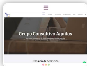
Grupo Consultivo Aguilas